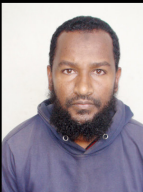
ሚሊዮን ብረይ ንርኤ