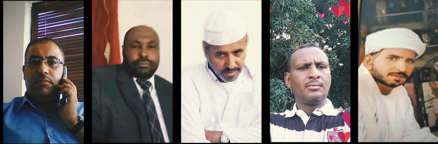
በጦር መሣሪያ ዝውውሩ የተሳተፉ የተለያዩ አገራት ዜጎች፤