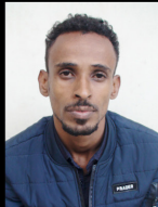
ሁለን ሲራጅ ትኩ