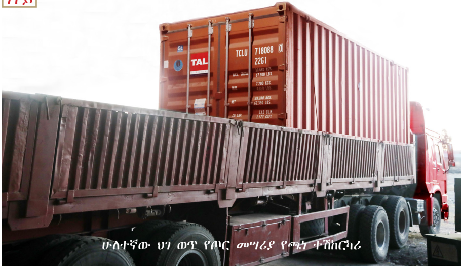
ሁለተኛው ህገ ወጥ የጦር መሣሪያ የጫኑ ተሽከርካሪ