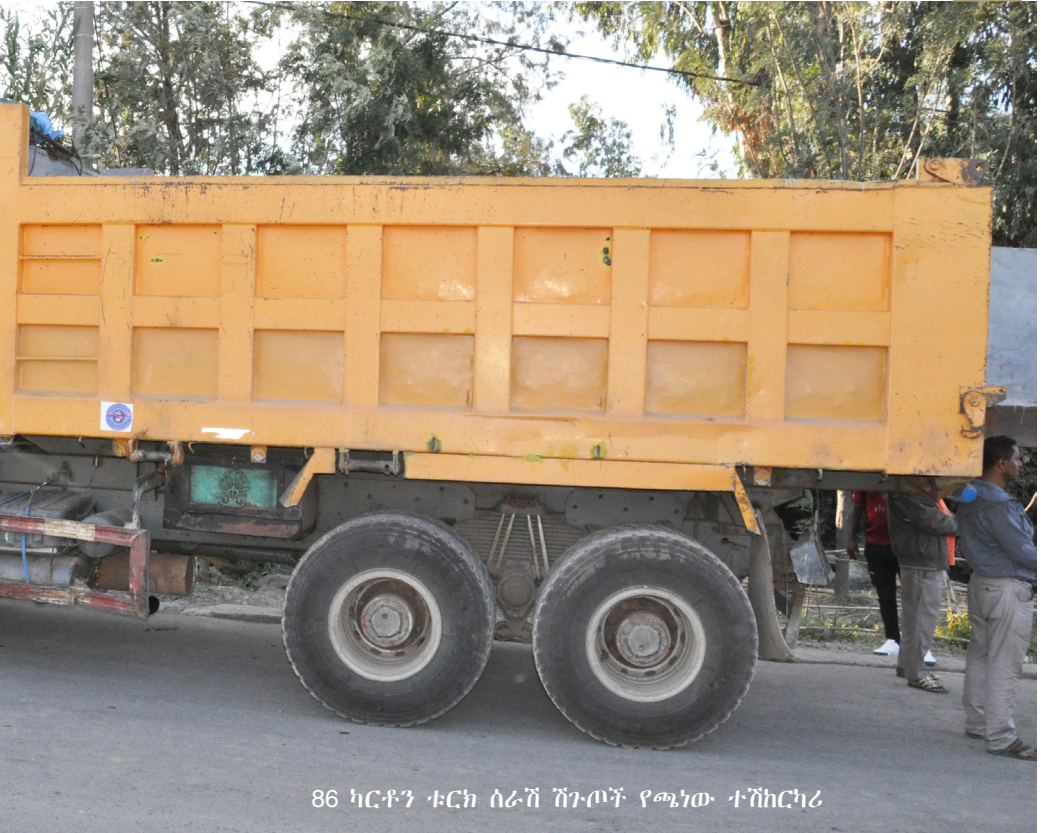
86 ካርቶን ቱርክ ሰራሽ ሽጉሎች የጫነው ተሽከርካሪ

የጫነው የቤት መኪና በሰውና በካሜራ ስውር ክትትል ስር ነው። በዚህ በክትትል ስር ካለው ሲግናል አካባቢ ወረደ። ይህ ሰው ከቱርክ የተላከውን የጦር መሣሪያ በኢትዮጵያ ተቀብሎ የማሰራጨት ስራውን የሚመራው መሀመድ ጀማል ነው። መሀመድ ከመኪናው ከወረደ በኋላ በቅርብ ርቀት ሲከታተሉት በነበሩ የፀጥታ ኃይሎች በቁጥጥር ስር ዋለ።