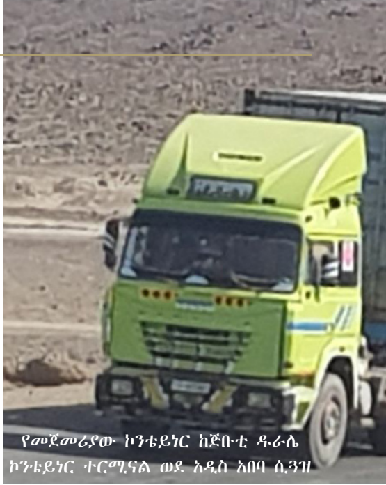
የመጀመሪያው ኮንቴይነር ከጅቡቲ ዱራሌ ኮንቴይነር ተርሚናል ወደ አዲስ አበባ ሲጓዝ

እንዲሻገር የሚያስችል መሆን አለበት። ከብዙ ምክክር በኋላ አንድ የህግ መሻገሪያ አሰራር ተገኘ። ኮንቴይነሩ ያለ ሌተር አፍ ክሬዲት (letter of credit) የጉምሩክ ኬላዎችን ሊያልፍ የሚችለው ምርቱ ለመከራ ገበያ ከውጭ የሚመጣ ወይም በፍራንኮ ቫሉታ ስርዓት ወደ አገር ውስጥ የሚገባ ከሆነ ብቻ ነው። ይህ ፍቃድ ከጉምሩክ ኮሚሽን የሚገኝ በመሆኑ በኮሚሽኑ አመራሮች እገባ አስመጭው ድርጅት ኮንቴይነሩን ወደ አገር ውስጥ እንዲያስገባ የሚያስችለውን ፍቃድ አገኘ።